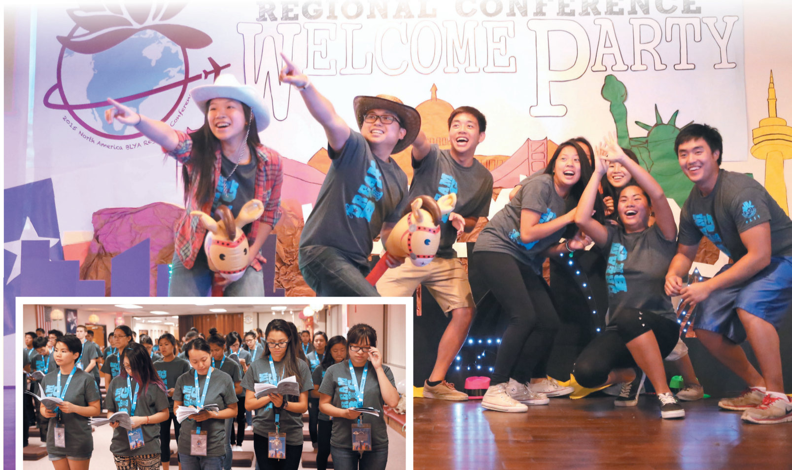
↑達拉斯青年設計「歡迎來到達拉斯」活動。 ↓活動後眾人至大殿晚課，結束首日活動。

【人間社記者妙住達拉斯報導】佛光山達拉斯講堂日前舉辦「北美佛光青年生活營」，貴賓及法師與來自北美各地青年，共一百五十位參與。