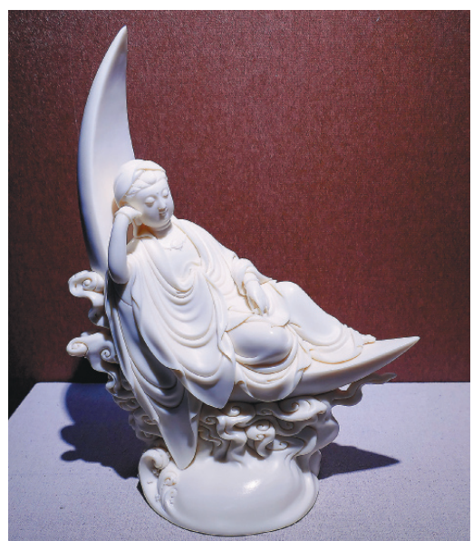
↑瓷塑作品〈水月觀音〉。

英〉，藉由飄散幸福的蒲公英種子，傳達對大家的祝福。另外他十分敬重地藏菩薩救度六道眾生的大願，創作不同形象的地藏塑像，也將佛門的地、水、火、風的元素融合在作品中。