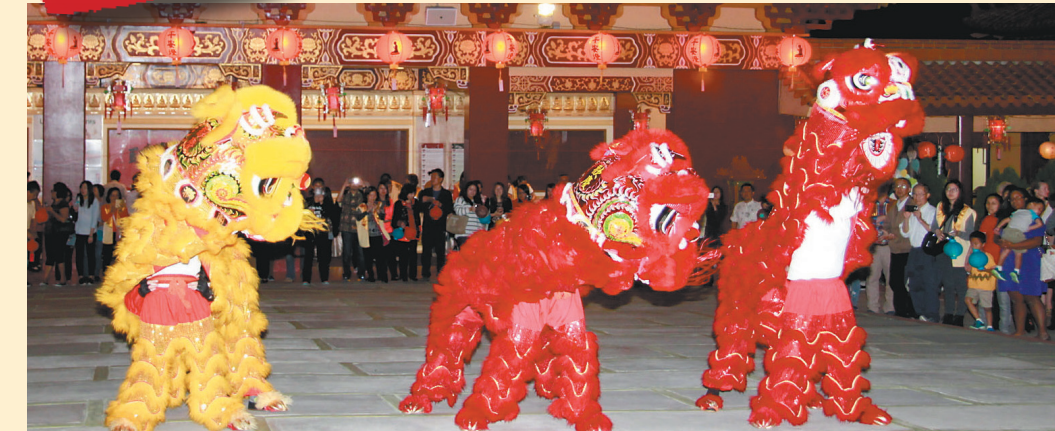
七十餘位海外學子齊聚觀賞舞獅表演。