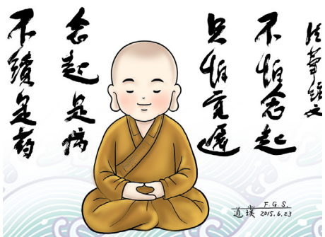
圖 / 道瑛