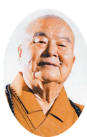
星雲大師 / Venerable Master Hsing Yun

業的定義是：1.自力創造，不由神力。2.機會均等，絕無特殊。3.前途光明，希望無窮。4.善惡因果，必定有報。