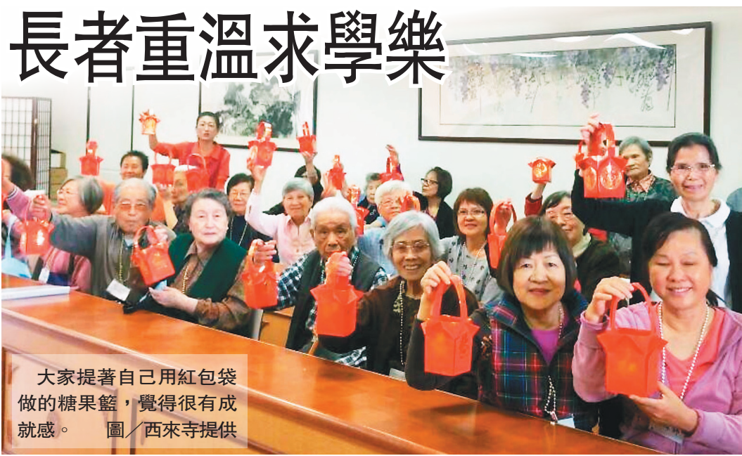
大家提著自己用紅包包做的糖果籃，覺得很有成就感。