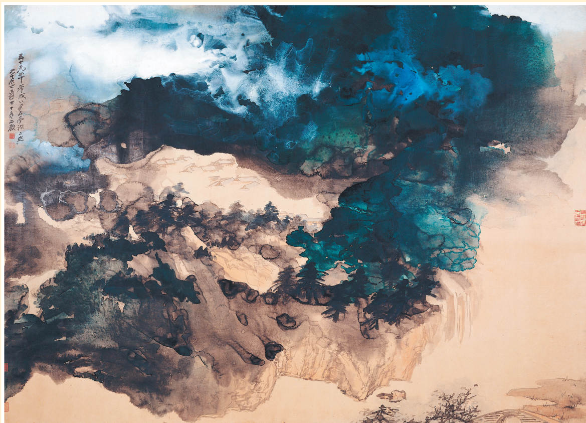
↑張大千具代表性的潑墨青綠山水畫作〈夏山雲瀑〉。