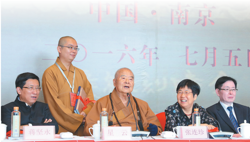
▲金陵刻經處成立一百五十周年活動開幕，星雲大師（中）應邀參加，國家宗教局局長王作安（右一）、江蘇省政協主席張連珍（右二）、國家宗教局副局長蔣堅永（左）等貴賓蒞臨致詞。

金陵刻經處一百五十周年系列活動之一的「佛教文化出版成果展」，集合了中國大陸一百一十多家出版社、六十多家雜誌期刊社、參展的圖書有三千五百餘種、一萬兩千餘冊，佛像、書法、音樂等二百餘種，是中國大陸改革開放以來最大的佛教文化展，星雲文化教育公益基金會亦受邀參展，展出歷年來星雲大師在大陸出版的圖書百餘冊。