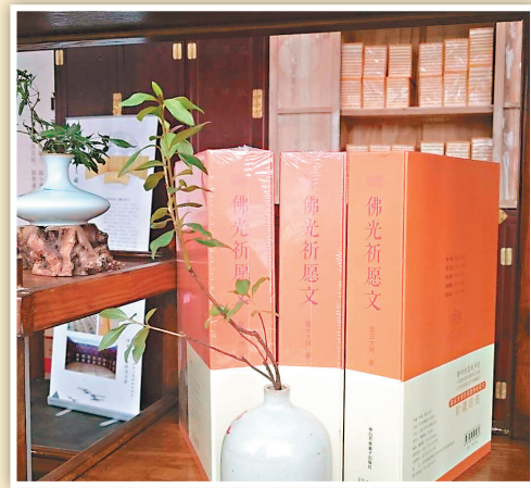
►大報恩寺遺址公園內舉辦佛教文化出版成果展，是大陸改革開放後最大的佛教文化展，星雲大師的書是展覽中的一大亮點。