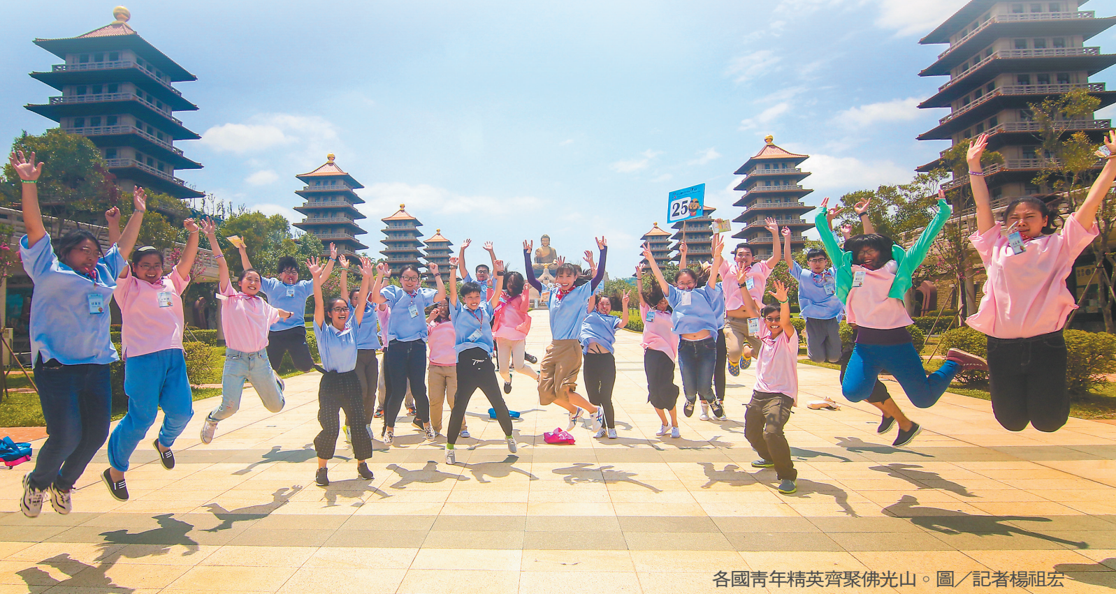
各國青年精英齊聚佛光山。

【記者李祖翔大樹報導】全球知名禪修活動「二〇一六國際青年生命禪學營」日前熱鬧登場，三十八個國家、近四百所大專院校，多達一千名青年齊聚佛光山，其中近半數是來自世界百大名校的精英。他們期待感受佛光山開山星雲大師不分彼此、尊重包容、同體共生的慈悲胸懷；佛光山寺副住持慧峰法師勉勵學子，觀照自心、找到真理與智慧。