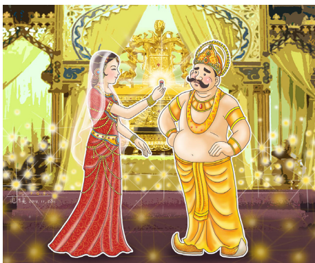
圖 / 道璞

波斯匿王經過這樣的事情後，從此深信，一個人的窮通禍福，不是別人所能左右的，各人有各人的福報，一個人過去播種幾分，現在收穫就有幾分。