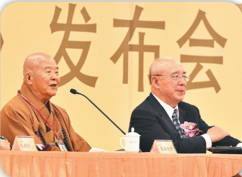
↑星雲大師（左）親臨發表會，國際佛光會世界總會榮譽總會會長吳伯雄（右）陪同赴會。