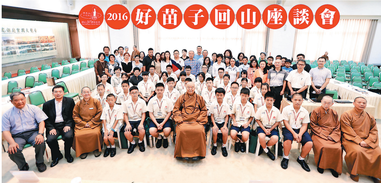
↑ 星雲大師（中）與好苗子及家長大合照。