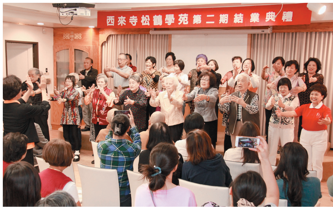
↑ 四十多名學員用歌唱配合手勢表演〈佛光照耀著你〉和〈手把青秧插滿田〉。

許多參觀的專業人士，包含歐美和大陸的出版人，都被佛光山的展品所吸引，仔細翻閱書中的內容，並向妙希法師詢問佛光山出版的方向，雙方交談融洽，現場也透過書法的方式，推廣每個中文字中，都有許多不同的含義，將文字化為人間佛教的精神。