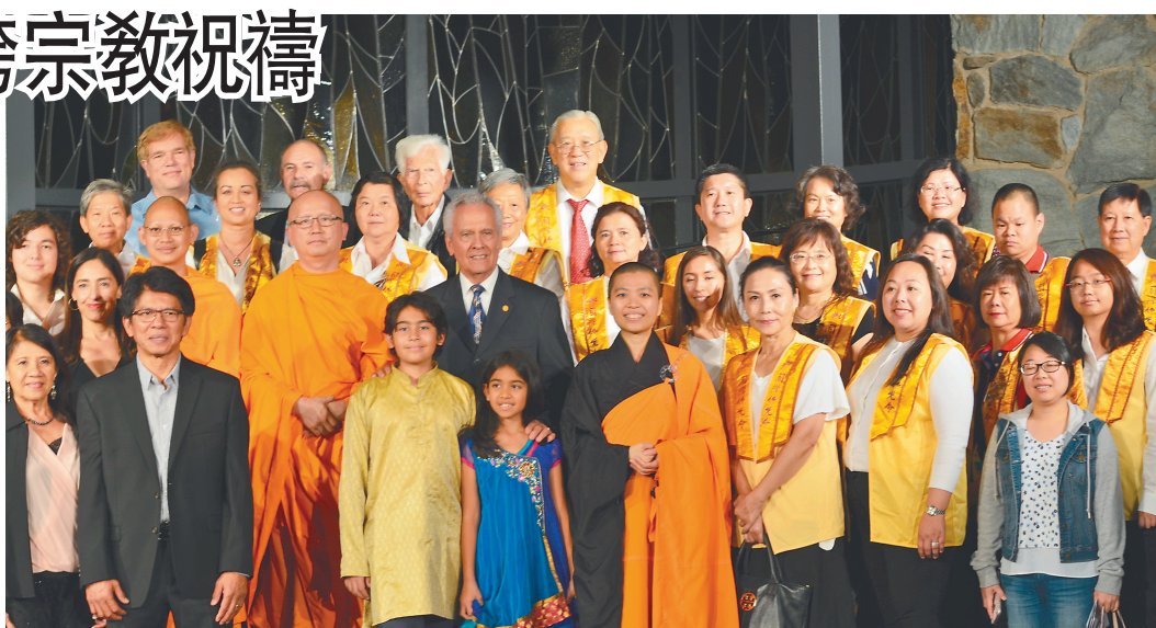
↑佛光山西來寺受邀參加「國際和平日慶祝活動」，圖爲佛光人與現場宗教團體人士合照。

活動在全體大眾起立演唱〈Let There be Peace on Earth〉後，圓滿落幕。