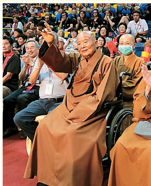
↑2018佛光盃大學籃球邀請賽，於高雄巨蛋舉行開幕典禮，星雲大師親臨現場向大家揮手致意。