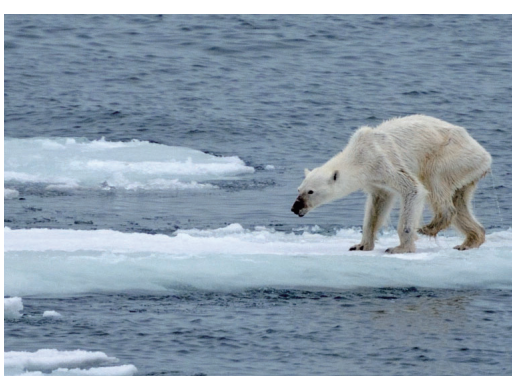
↑溫室效應，使北極圈冰層加速融化，專家警告未來100年內，北極熊將會滅絕。