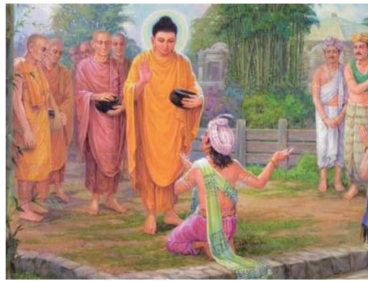
↑頻婆娑羅王參拜悉達多太子。

你捨去世間最高貴的王位，脫離了歷史悠久的光榮種族，身上穿了壞色的袈裟，終日過著乞食的生活，這叫人真是難以理解。本來，天下都快在你的掌握之中，你卻辛辛苦苦地求人受一餐之施，這究竟是什麼原因呢？請你能坦白地告訴我嗎？