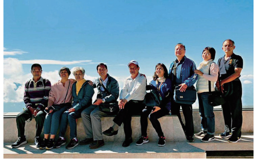
藍天白雲下歡愉的手足。

媽媽說過這是她想念阿公時，最愛做的小吃，當年阿公的綽號台語就叫做「芋翹」俗稱為「芋頭粿」，日據時代阿公在港務局上班，僅靠微薄薪水要養活六個孩子，當時有人看他愛吃芋頭，索性幫他取有趣的綽號，這道「芋頭粿」飽足美味阿嬤常常做，那時候一家人有人將芋頭剉成一絲絲，或是切成小塊狀，有人揉外皮，有人剪香蕉葉當底用，炒料要包的內餡由阿嬤掌廚，當蒸籠緩緩飄散出香氣，那一刻一起吃粿幸福的情景，至今記憶深刻回味