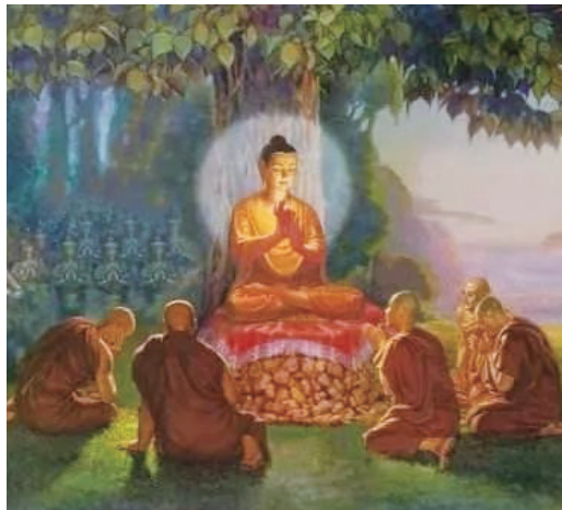
↑佛陀於鹿野苑度五比丘