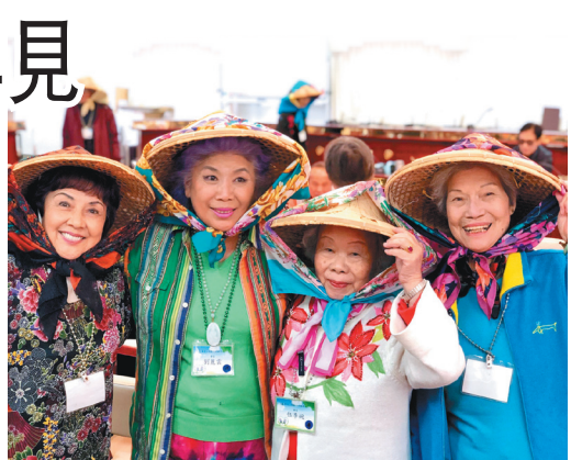
↑佛光山西來寺松鶴學苑日前舉行第12期結業典禮，學員為了表演唱山歌而精心裝扮。