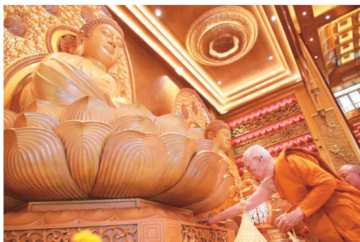
↑泰國僧王頌德帕摩訶穆尼翁親臨佛光山泰華寺，為三寶佛聖像主持開光。