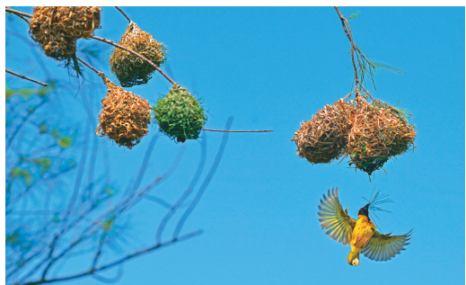
為了築巢，黑頭織布鳥努力地叨來樹枝。