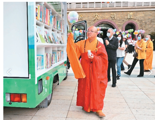
↑2020國際書展暨蔬食博覽會 在佛光山佛陀紀念館開幕，佛光山住持心保和尚為「雲水書車」灑淨。圖/人間社記者梁清秩