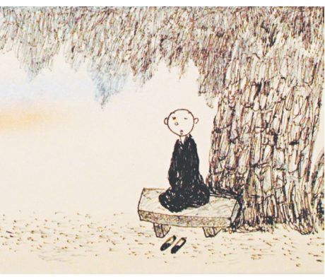
圖 / 李蕭銀

人人有佛性，用現代的話來說就是民主思想，人人平等，人人都可以做總統，人人都可以當家作主，但是，這也要直下承擔才可以。這位知義禪僧，不亢不卑，也就沒有辜負大慧宗杲禪師所期望的，人人都做釋迦老子了。