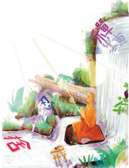
圖 / 游智光

此次美國柏克萊大學校長桑德士博士在山上小住數日，和我談到：過去的基督教，也和我們目前的佛教一樣，只重精神，而忽略了現實人生和實際上的生活問題，一直不為大眾接受。經過了多少時間，許