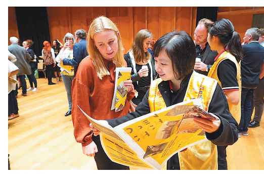
↑南島佛光人向與會者介紹南島佛光山，並宣導「佛誕節浴佛法會與園遊會」。

幾個特點：1、龍門石窟外牆上四大菩薩的設計非常創新、獨特；2、整體建築完美結合東方藝術及西方技術；3、以天然的材料打造，體現佛教惜福、樸實的美德；4、在鬧市中提供寧靜、優美的休閒空間；5、如來殿「開門見山」的設計看到佛陀守護人民的慈悲；6、建築內有充足、多元的硬體設施。