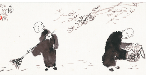
圖 / 李蕭銳

要做佛門龍象，先做眾生馬牛；假如心中有所分別，馬牛又怎麼能做得長久呢？地藏王菩薩到地獄裡面度眾生，假如他覺得地獄很苦，又怎麼能到「地獄不空，誓不成佛」呢？真正的苦行，是苦中不覺苦，一切是那自然，才能與禪心相應哦！