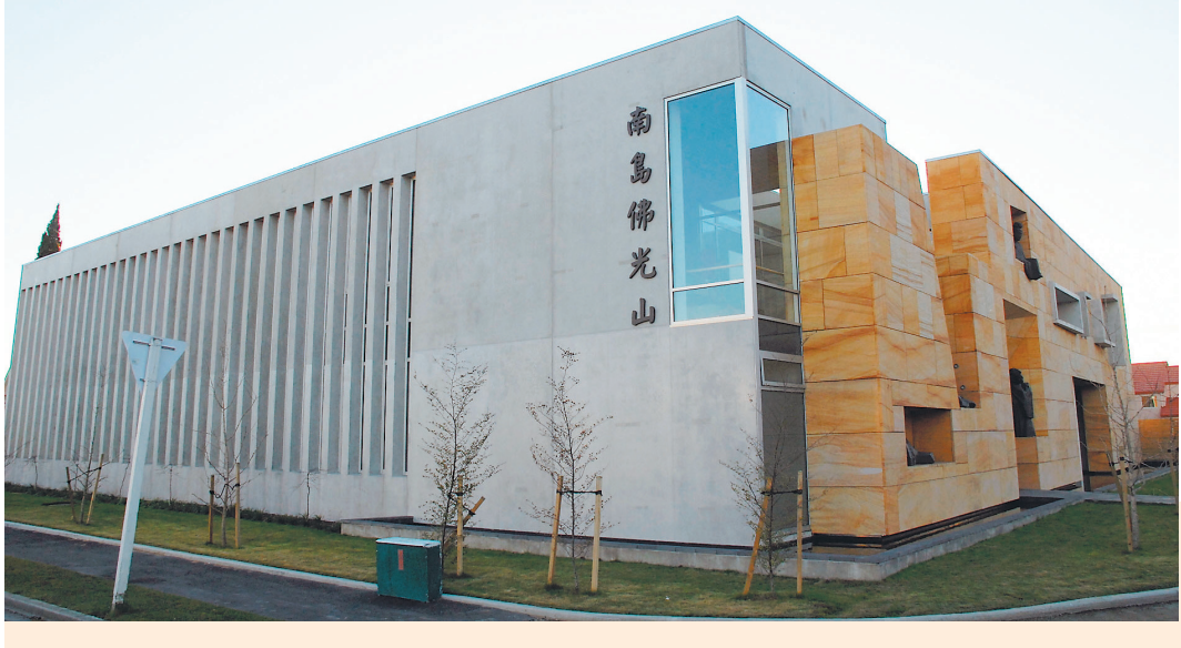
↑紐西蘭南島佛光山獲選為「基督城開放日」活動建築地標之一。