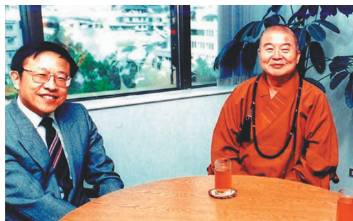
↑佛光會北美雲來集講壇邀請遠見·天下文化事業群創辦人高希均教授（左）主講「星雲大師的歷史地位」。圖為1989年高教授與星雲大師初識於台北的合影。