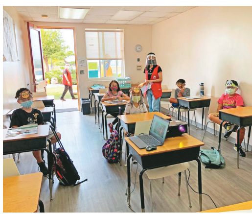
↑教室裡，師生們戴口罩及面罩。

首日課程圓滿，下午6點一到放學，老師們帶領學生至家長接送區，滿兆法師更是歡喜地目送小朋友們回家。