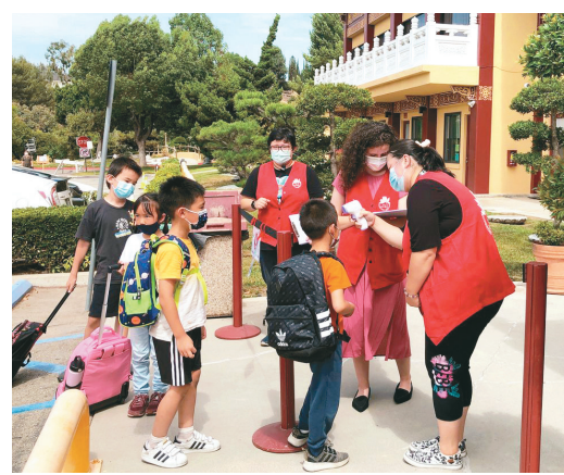
↑佛光西來學校課後輔導班開學，為做好防疫措施，學生進校園前要先量體溫。

輔導班開學第一天，西來學校行政人員分批前往當地公立學校，了解學生放學及搭校車的情況。許多家長們看到西來學校老師，紛紛上前問候關心並交流孩子們的近況；亦有家長表示，想要了解相關西來學校課程，以及接駁上下學的方式，確認