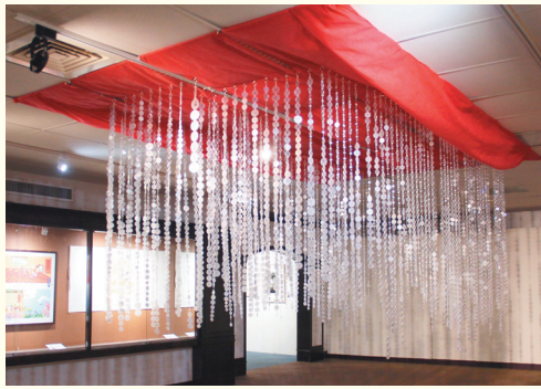
▼立體類佛光獎為南天寺全體製作、逾5000個熱縮片串成的〈夢幻泡影——《金剛經》〉。

【人間社記者李生鳳大樹報導】「耕耘心田——佛光山2021年徒眾作品巡迴聯展」即日起於佛光緣美術館總館展出，參展者不是畫家或書法家，而是佛光山的法師、入道師姑。佛光山開山星雲大師期望徒眾以藝術弘揚佛法，佛光山傳燈會、佛光緣美術館總部從2017年起，開辦「佛光山徒眾作品聯展」，年年向徒眾徵件，廣受歡迎。聯展中除了能看見今年獲獎作品，也能一覽歷年優秀創作，未來這些藝術品將出版畫冊。