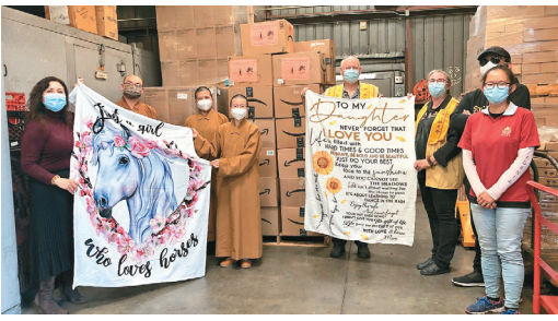
↑西來寺法師及佛光人至Hacienda La Puente聯合學區，捐贈毛毯等物資。

捐助對象包括老人照顧中心、殘障兒童關懷中心、遊民收容所、低收入戶、動物收容所、動物醫院及Hacienda La Puente聯合學區(Hacienda La Puente Unified School District)等；這些慈善組織、公益機構跟西來寺合作多年，他們皆表示，這些捐的物資，會再分送給有需要的人士。