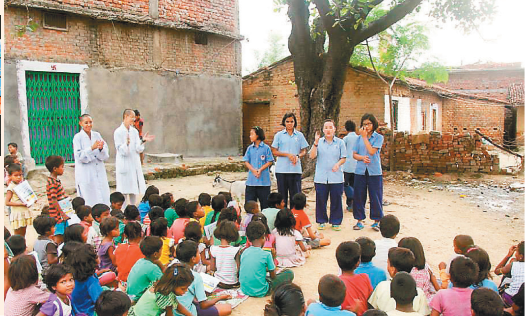
→ 「大樹下的課堂」由佛光山印度佛學院學生、法師，為鄉村學童授課、教育三好。圖 / 資料照片

【人間社記者蔣祖芬紐約報導】聯合國婦女署婦女地位委員會第66屆平行會議，3月16日進行第3天議程，聚焦「國際佛光會在印度——促進女孩和婦女的平等」，佛光會發表印度「大樹下」教育專案，分享佛光山開山星雲大師在印度弘法、倡議婦女受教權至今的成果，近千人跨越時空雲端共襄盛舉，了解佛光會透過教育賦予印度女孩和婦女權力的工作，以及未來在可持續發展的目標。