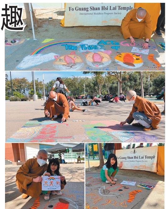
佛光山西來寺受邀參加「第1屆St. Patrick's Day周末粉筆彩繪嘉年華」，一同爲社區增添色彩。