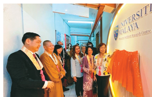
↑馬來亞大學「人間佛教研究中心」，11月21日正式揭幕。