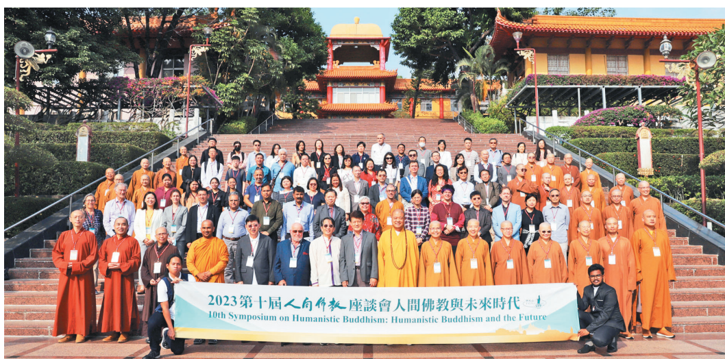
「第10屆人間佛教座談會——人間佛教與未來時代」12月15日至17日在佛光山舉行，與會學者於靈山勝境合影留念。